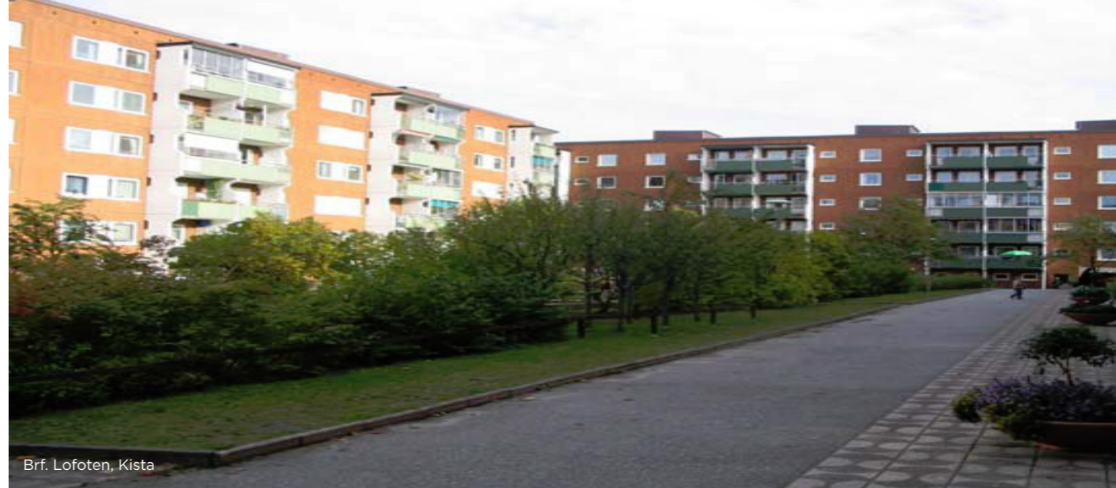
Brf. Lofoten, Kista