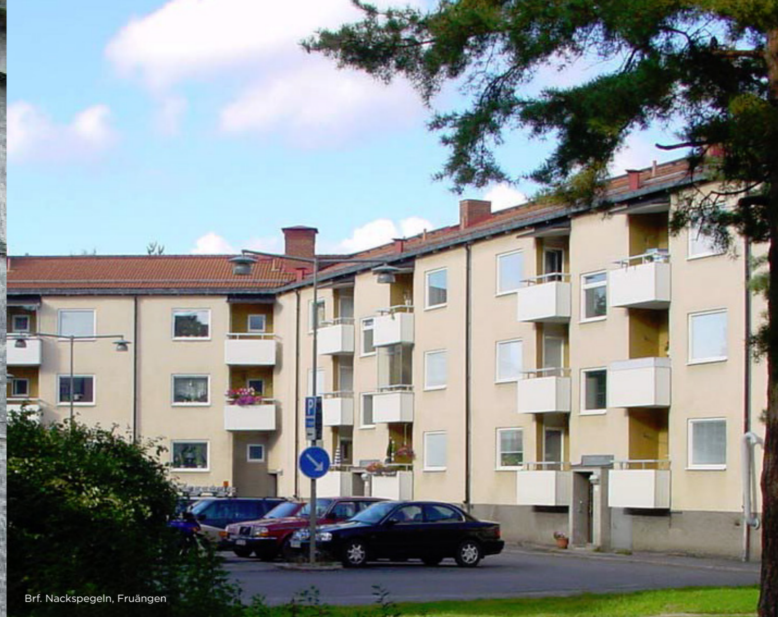
Brf. Nackspegeln, Fruängen

Snidex Renova® uppfyller de flesta önskemål en fastighetsägare kan ha på en framtida fönsterförändring.